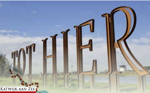
KATWIJK AAN ZEE

In het Arnhemse stadsdeel Meinerswijk ligt een Romeins fort dat vermoedelijk rond het jaar 15 na Christus werd aangelegd. Het fort had een strategische ligging aan de Rijn, tegenover de monding van de voorloper van de IJssel, en speelde een belangrijke rol in de Germaanse veldtochten van de Romeinse generaal Germanicus. Wandel door de huidige visualisatie van het fort, tussen de schanskorven gevuld met stenen, en ervaar de enorme afmetingen van dit voormalige fort.