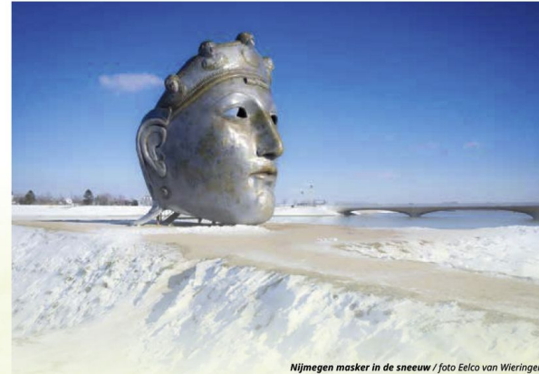
Nijmegen masker in de sneeuw