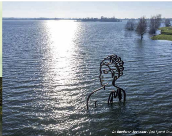
De Baadster, Zevenaar