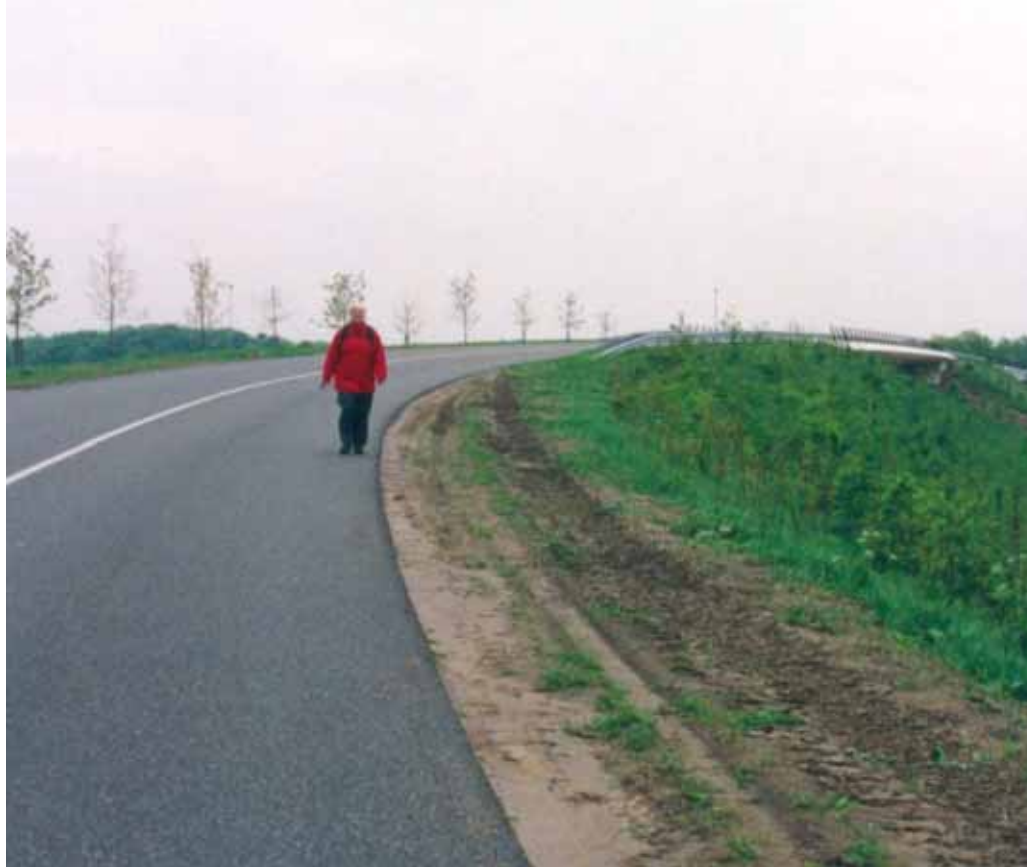
Ongelijkvloerse kruising, onaantrekkelijk voor recreanten

Ongewijzigd beleid leidt tot verhoging en kwaliteitsverlies van de leefruimte.