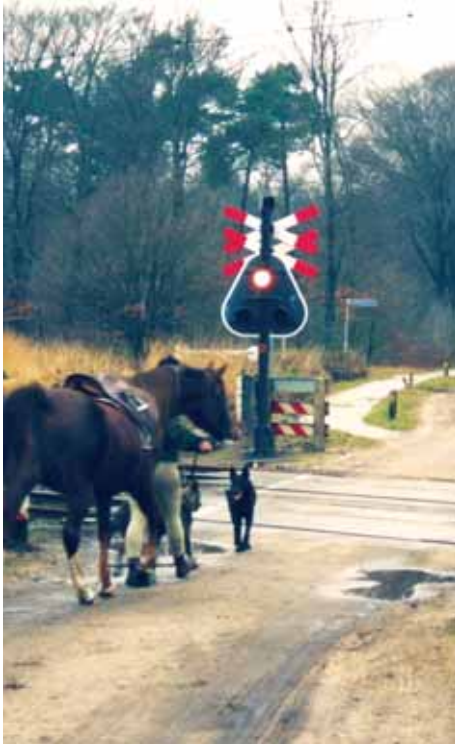
Renkumseweg, Ede. Voor en na ombouw van knipperlichtbeveiliging naar mini-ahob.