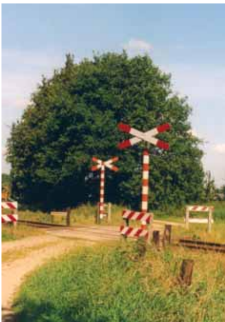
Fietspad Ruurlo - Lichtenvoorde

Bij het opheffen van verbindingen kan de auto het gemakkelijkst omrijden en is de wandelaar het meest kwetsbaar.