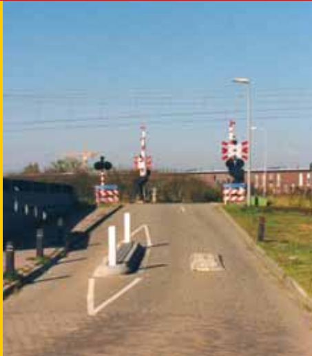
Zoneringsmaatregel, alleen langzaam verkeer