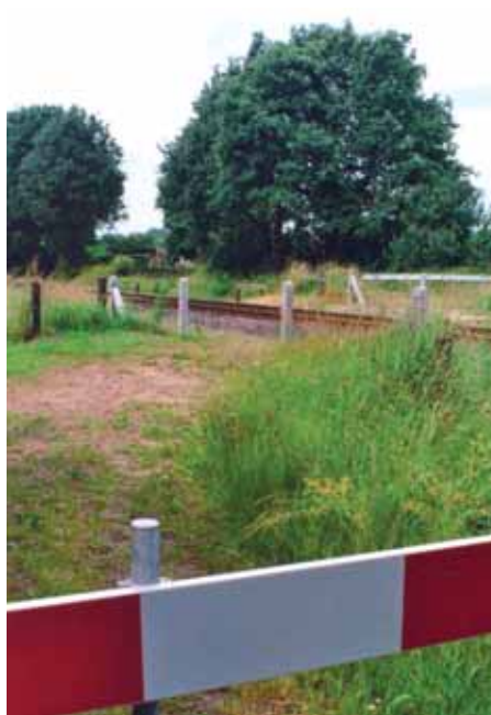
Dezelfde overweg, nu opgeheven

Behalve bijdragen aan meer bewustwording, wijzen de koepelorganisaties op alternatieven voor het opheffen van overwegen en hebben ze de recreatief-toeristische belangen van alle overwegen in het land in kaart gebracht. Het doel is bij te dragen aan evenwichtiger beleid. In de Handreiking maken de drie organisaties hun expertise toegankelijk voor de overheden die verantwoordelijk zijn voor de overweganeringen. Verder willen de koepelorganisaties met hun kennis graag actief betrokken worden bij de besluitvormingsprocessen.