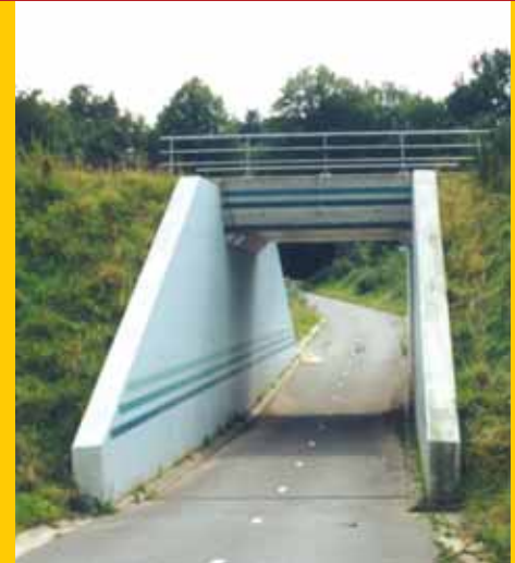
Tunnel alleen voor fietsers

Verkeer en Waterstaat hun beleidsdoelstellingen eigenlijk al hebben gehaald. In de Kadernota Railveiligheid staat dat het aantal dodelijke slachtoffers in 2010 moet zijn gehalveerd ten opzichte van het peiljaar 1985. Die halvering was in 2005 een feit als gevolg van de vervanging van automatische knipperlichtinstallaties door mini-overwegbomen (mini-ahobs). Het ministerie wil de kans op ongelukken nu nog verder terugdringen met risico-uitsluitende maatregelen.