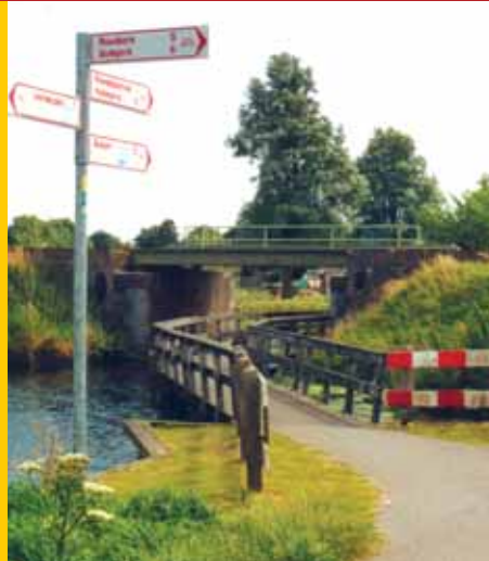
'Brug', maakt gebruik van viaduct over watergang