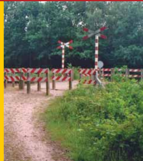
Mini-ahob: net als nevenstaande voorbeelden is dit Zigzag-hek een voor recreanten positieve oplossing.